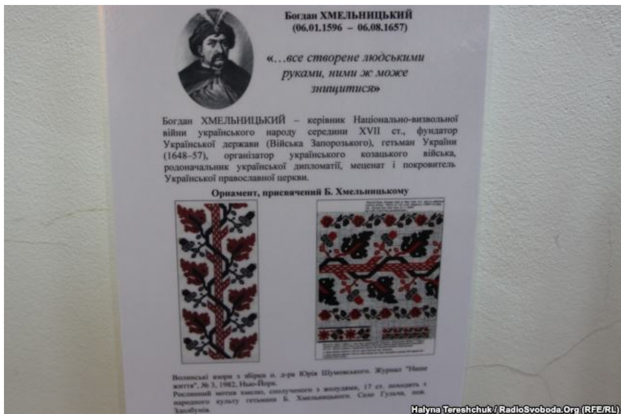
Орнамент, присвячений Богдану Хмельницькому

Князь Аскольд, українські гетьмани, політичні і культурні діячі різних століть, відомі українські письменники, духовні провідники – митрополит Андрей Шептицький, кардинал Йосип Сліпий, патріарх Мстислав, дисиденти, шістдесятники, герої Небесної сотні, українські воїни. Поруч із фотографіями розповідь про людей, які відіграли велику роль в історії України. Людмила Огнева досліджувала і шукала інформацію у піснях, поезії, образотворчому мистецтві, музеях, архівах, де згадується конкретна особа і пов'язана з нею вишивана річ. Людмила Огнева відтворила орнамент XVII століття, присвячений Богдану Хмельницькому. Сама робила схеми вишивки, підбирала кольори і вишивала.