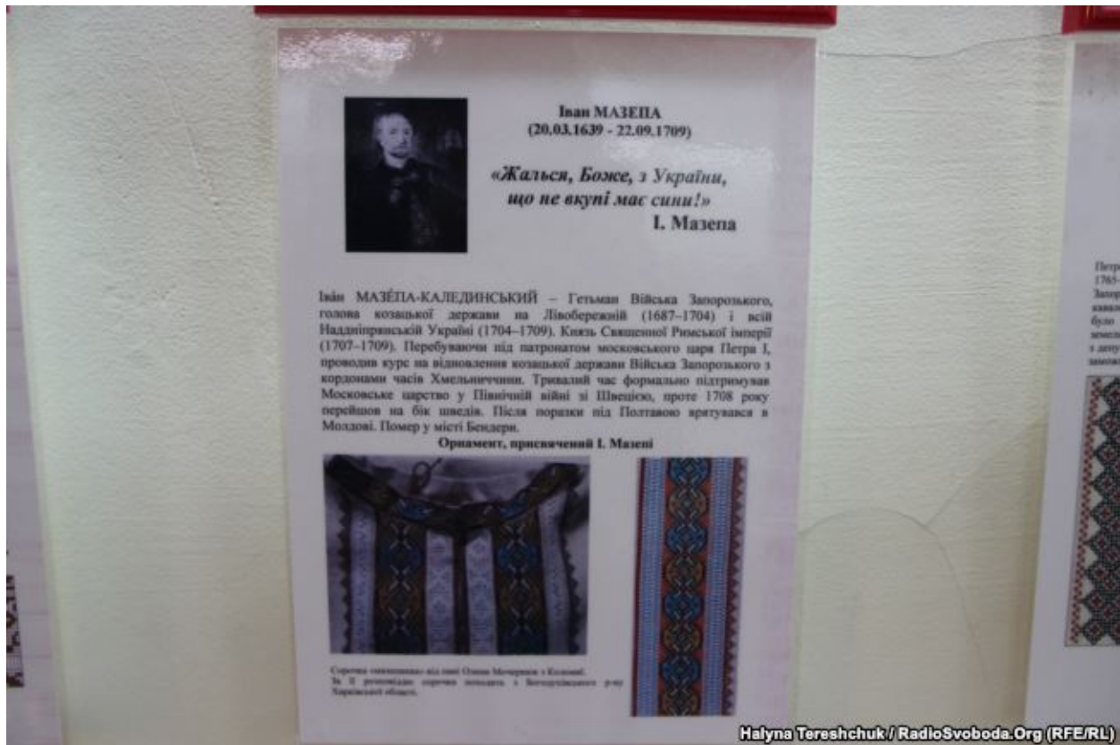
Орнамент, присвячений Івану Мазепі

Орнамент, присвячений українському дисиденту, політв'язню Данилові Шумуку, Людмила Огнева відшила з рамки, в якій був портрет діяча. У сорочці для гетьмана Павла Полуботка Людмила Огнева використала візерунок, що впливає на загоєння ран, у орнаменті, присвяченому провіднику ОУН Євгенові Коновальцю, є дуб як символ мужності.